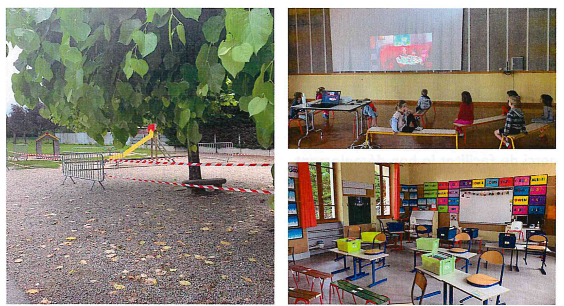
Ce lundi 8 juin certains enfants de notre RPI ont repris le chemin de l'école dans des conditions sanitaires particulières. L'école de Limons a accueilli les enfants de personnels prioritaires dans la salle des fêtes de la commune du 12 mai au 5 juin dernier.