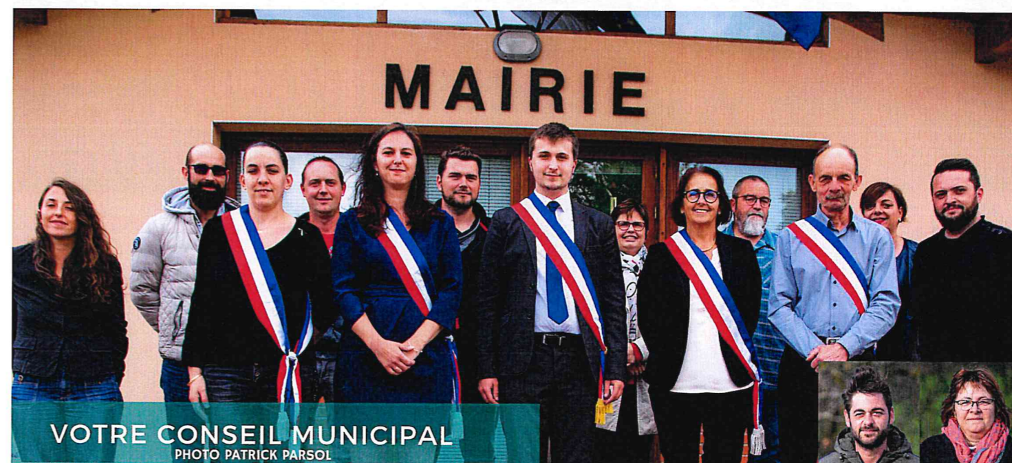
VOTRE CONSEIL MUNICIPAL